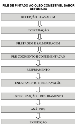
Figura 1. Fluxograma de produção de filé de pintado ao óleo comestível sabor defumado

(57) Resumo: Trata de um processo para produção de filé de pintado ao óleo comestível sabor defumado, contemplando as etapas de recepção(a) e lavagem do pescado(b); evisceração do pescado(c); filetagem do pescado(d) e salmouragem da carne (e); pré-cozimento da carne(f1) e condimentação do molho (f2); resfriamento da carne e do molho(g); enlatamento do produto(h); esterilização(i) das embalagens metálicas contendo o produto, seguido de resfriamento(j) e análises físico-químicas, sensoriais, microbiológicas (testes de esterilização comercial)(k). Os processos pelos quais o produto é submetido garante ao mesmo estabilidade microbiológica, oxidativa e sensorial durante 48 meses, portanto, em condições de consumo sem perdas significativas da sua qualidade. Acrescenta-se que em função dos processos pelos quais o produto é submetido o mesmo pode ser transportado em temperatura ambiente não dependendo, portanto, de sistema de refrigeração ou congelamento durante a sua distribuição, o que provoca uma redução dos custos com distribuição e conseqüentemente, chegue ao consumidor final com preço atrativo, além de se caracterizar um alimento saboroso e de boa qualidade higiênico-sanitária e nutricional.