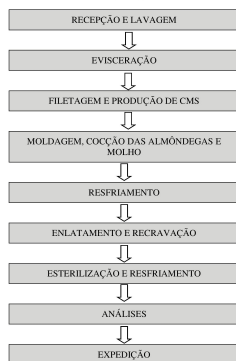
Figura 1. Fluxograma de almôndegas de pintado ao molho branco com parmesão