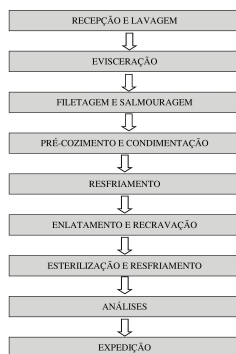
Figura 1. Fluxograma de produção de pirarucu ao molho de tomate com pimentão