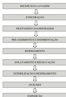
Figura 1. Fluxograma de produção de pirarucu ao óleo comestível sabor defumado