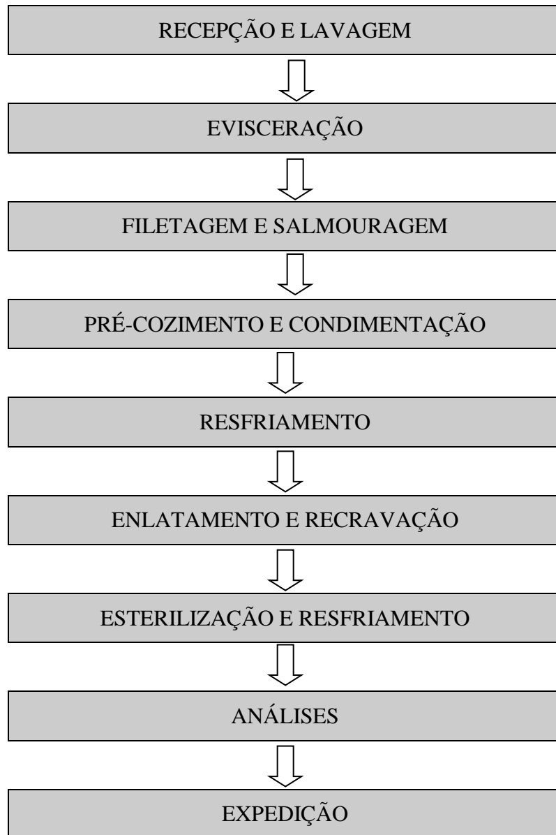
Figura 1. Fluxograma de produção de filé de jatuarana ao molho de tomate com pimentão