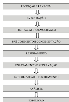
Figura 1. Fluxograma de produção de filé de tambaqui ao molho de tomate sabor defumado.